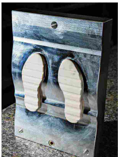
La realizzazione degli stampi per soles in gomma nell'Engineering e Moulding Division di Finproject ad Ancarano (Teramo). Nell'altra pagina: stivale per piattaforme petrolifere