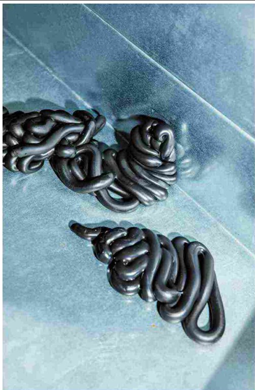
La lavorazione iniziale degli stampi. A destra, XL Extralight, materiale espanso a celle chiuse